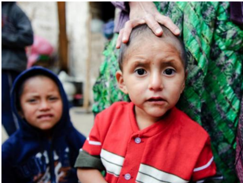
Ondervoeding in Guatemala