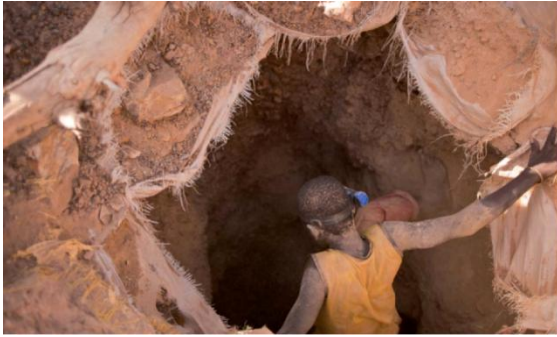
In Burkina Faso tegen kinderarbeid in de goudmijnen