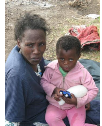
In Zambia de ziektes hiv en aids bij baby's voorkomen