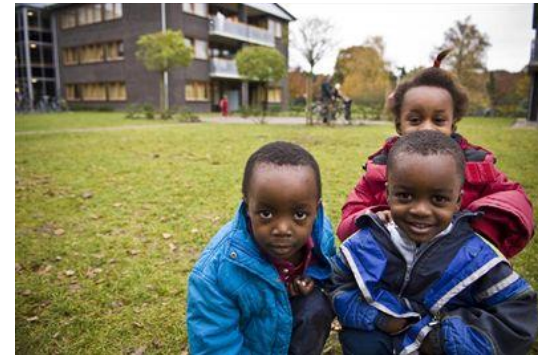
En zelfs in Nederland heeft Unicef een project voor asielzoekers.